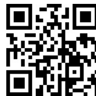
校務數據分析資訊